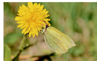
JARNÍ PŘÍRODA v okolí Ostravy.